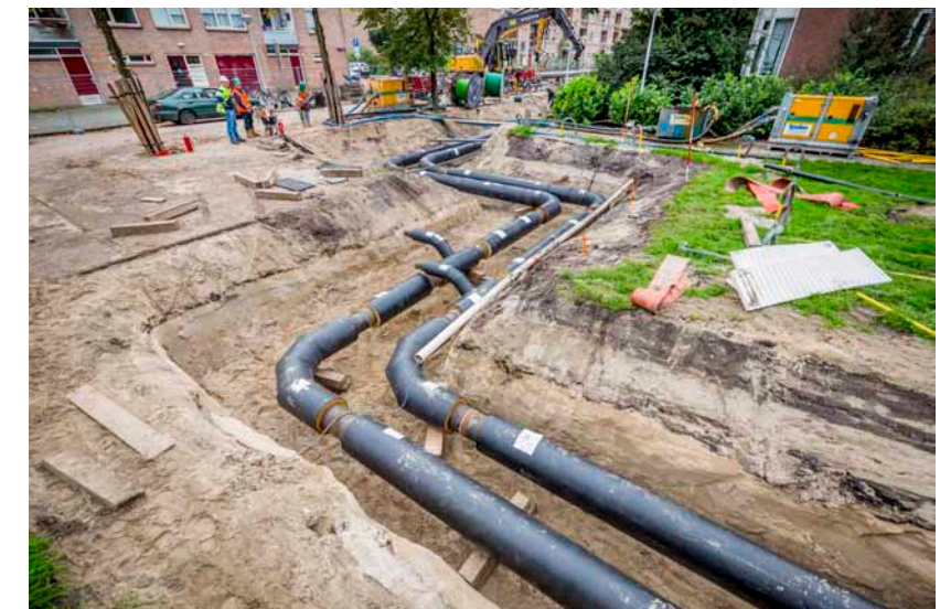
Open ontgraving: het werkkerrein wordt afgezet en er wordt tot ongeveer 1,5 meter diep gegraven om de warmtetransportleidingen (aanvoer- en retour) aan te leggen.

Om de werkzaamheden bij de Papaverhoek uit te kunnen voeren, moeten twintig bomen worden gekapt. De kap vindt plaats voor de start van het broedseizoen in 2016. Stadsdeel Noord heeft de kapvergunning op 7 juli verleend. Na de werkzaamheden worden op deze locatie twintig bomen teruggeplant.