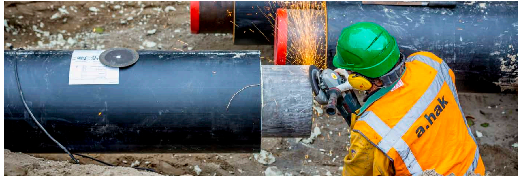
Lassen van de verbindingen: de warmtetransportleidingen worden aan elkaar gelast.

Ter plaatse van de Floraweg liggen de leidingen tijdelijk op een hoogte van circa 4.80m. Het zijn twee geïsoleerde leidingen (aanvoer- en een retourleiding) voor toekomstig transport van warm water voor stadswarmte. Deze leidingen gaan na afloop van de boring de grond in.